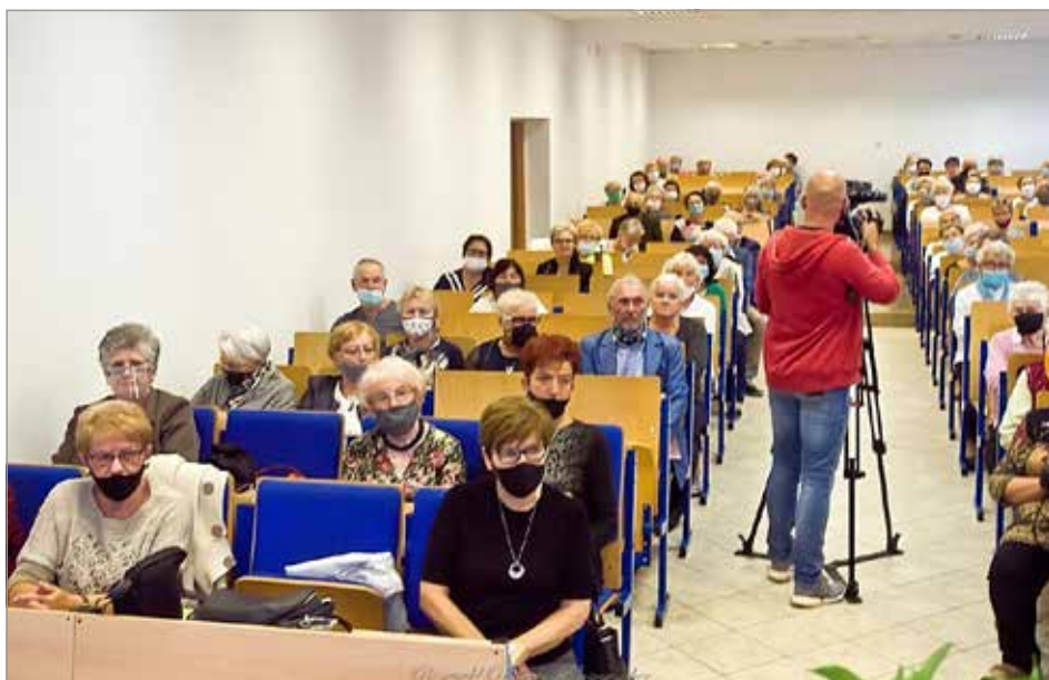
Zajęcia UTW przy WSBiP w Ostrowcu Świętokrzyskim, fot. Romuald Redlich