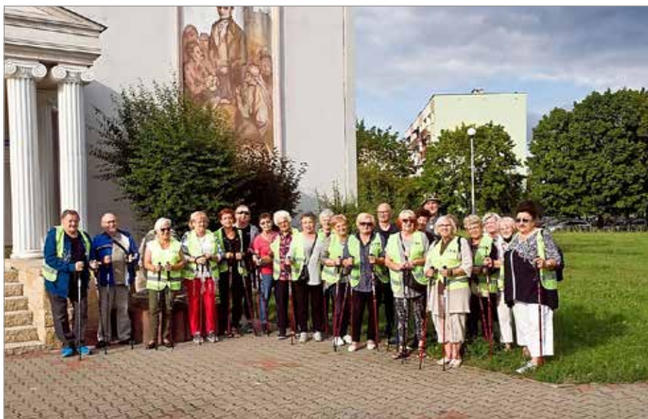
Grupa Nordic Walking

krzyskiego, ogółem 180 osób. Były to zadania publiczne: